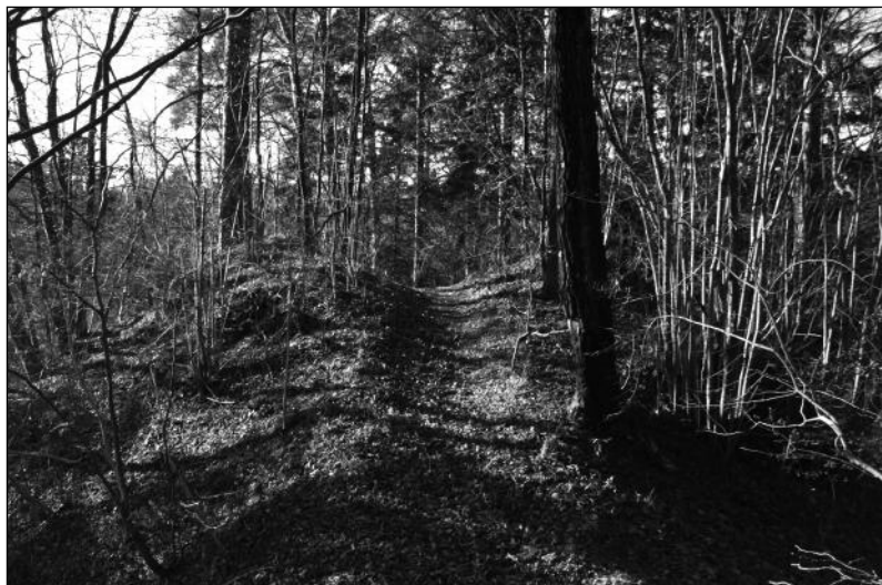
Fot. 1. Widok na relikty bramy wjazdowej grodziska Sądyty

groty strzał, przedmioty codziennego użytku i wiele fragmentów wczesnośredniowiecznej ceramiki 33 . Niewątpliwie do dokładnej weryfikacji tego miejsca skłonił mnie przede wszyst-