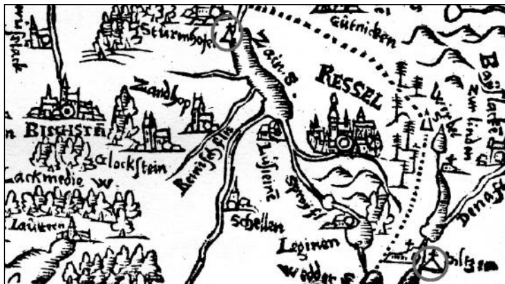
Ryc. 7. Fragment mapy K. Hennenbergera przedstawiający okolicę Reszla. Na mapce przedstawione są sygnatury przy obiektach w Pilcu (Piltzen) i Grzędzie-Pleśno (Sturmhofel). Warto zwrócić uwagę na wizerunki kościołów w Uniszewie (Glockstein) i Sątupach (Santopen), są bowiem identyczne ze współczesnymi

Kolejny kopczyk na terenie Warmii biskupiej Kaspar Hennenberger zaznaczył na zachodnim brzegu jeziora Sajno, na zachód od Reszla. Znak ten był powielany na nowożytnych przeróbkach jego map 43 . Miejsce owo położone jest w pobliżu wsi Pleśno (Plößen) i było wzmiankowane w latach dwudziestych