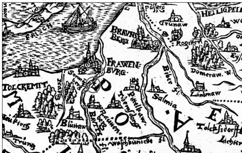
Ryc. 6. Fragment mapy K. Hennenbergera przedstawiający okolicę Fromborka. Widać Frombork od strony południowej oraz grodzisko w Bogdanach (Sonnenberg)

że znajdowała się tam siedziba Zompny z rodu Nartzenów 38 . W latach 1826–1828 grodzisko inwentaryzował Johann Guise, który w swoich notatkach zaznaczył, że jest to zamek Zompny