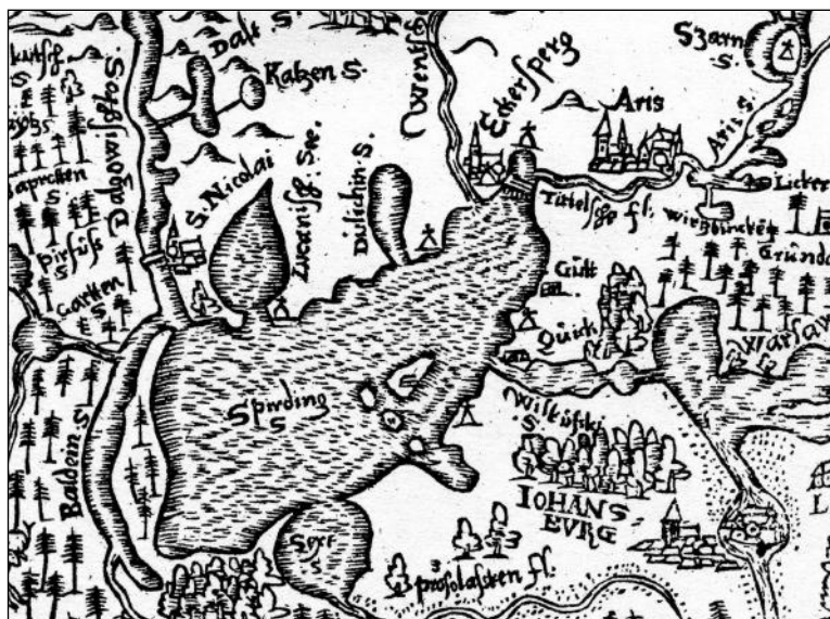
Ryc. 1. Fragment mapy K. Hennenbergera „Prussiae, das ist das Landes zu Preusse” z 1576 r. – okolica jeziora Śniardwy z zaznaczonymi sygnaturami

relikty założeń obronnych w pobliżu następujących miejscowości: Łuknajno, Tuchlin, Okartowo, Tyrkło, Nowe Guty, Kwik oraz Zdory. Obiekt w Okartowie był ruiną zamku krzyżackiego, ostatecznie zniszczonego przez