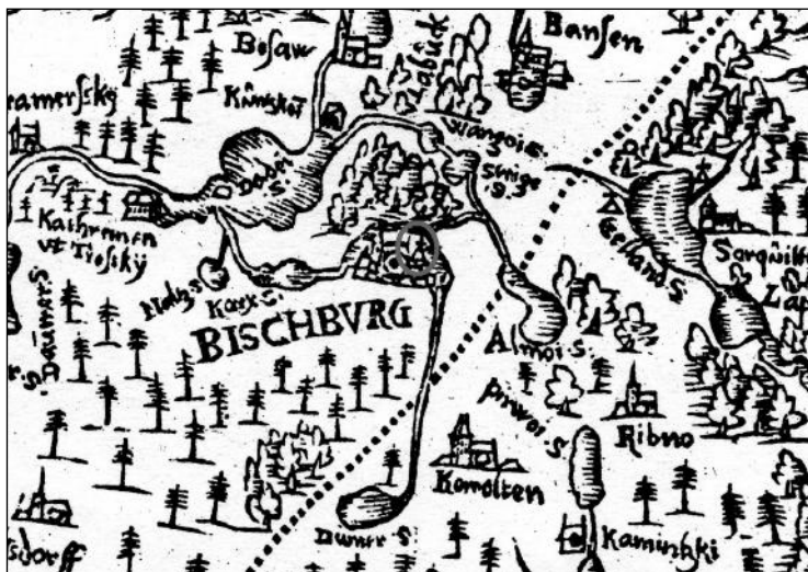
Ryc. 3. Fragment mapy K. Hennenbergera przedstawiający okolice Biskupca. Po prawej stronie kartograf zaznaczył dwa grodziska – tzw. kopce wartownicze (Stary Gieład i Młynik) już spoza obszaru Warmii

nych nowej wsi był zamek biskupi – „versus castrum nostrum Bischofsburg ”. Biskupiec prawa miejskie uzyskał sześć lat później, w dniu 17 października 1395 r., stając się tym samym najmłodszym miastem na terenie Warmii biskupiej. Dokument lokacyjny sporządzony został w miejscowym zamku. Tenże akt lokacyjny zawiera kolejną interesującą informację – otóż zezwolono mieszkańcom na budowę w obrębie miasta, naprzeciwko obwarowań i palisady, wieży obronnej 25 . Zamek nie przetrwał długo. Zniszczony podczas wojny trzynastoletniej nie podźwignął się już z ruin. W literaturze przedmiotu istnieje hipoteza, jakoby zamek w Biskupcu miał stać na północnym brzegu rzeki Dymer, naprzeciwko kościoła, ale już poza murami miejskimi 26 . W latach 1992–1997 na terenie Biskupca prowadzono prace archeologiczne, podczas których przebadano także obszar, gdzie rzekomo miały znajdować się pozostałości zamku. W świetle przeprowadzonych badań archeolodzy nie znaleźli relikwów takiej budowli, a jedynie pozostałości wczesnonowoczesnych pochówków 27 . Wszystko wskazuje zatem, że w tym miejscu nie było żadnych obwarowań, a jedynie stary cmentarz, który znajdował się już poza bramą i murami miasta. Przyjrzyjmy się zatem mapie Hennenbergera. Kartograf zaznaczył kopczyk w północno-wschodniej części miasta, przy południowym brzegu rzeki Dymer i w obrębie obwarowań miejskich. Jest to całkiem inne miejsce od proponowanego dotąd w literaturze.