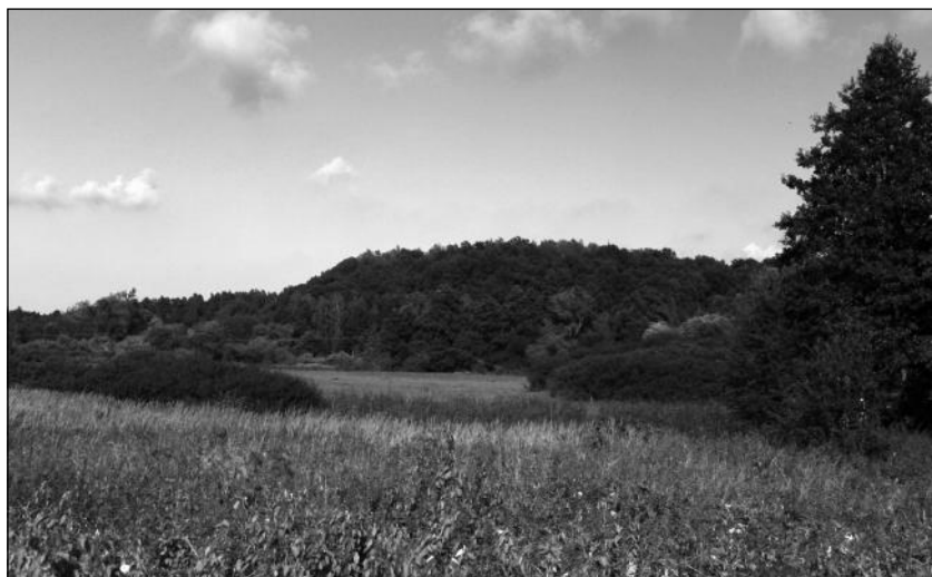
Fot. 2. Widok na grodzisko w Bogdanach od strony południowo-zachodniej