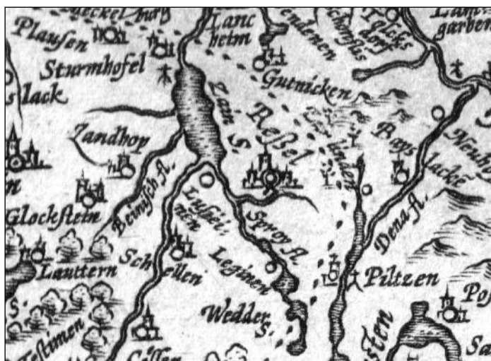
Ryc. 8. Fragment mapy Abrahama Orteliusa „Prussiae vera descriptio” z obiektami w Pilcu i Pleśnie