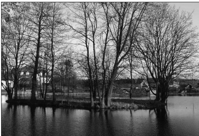
Fot. 3. Wyspa na Stawie Młyńskim w Pilcu – przypuszczalne relikty średniowiecznej strażnicy

nego w 1374 r. pozostawała pod jurysdykcją biskupa warmińskiego 47 . Według dokumentu z 24 czerwca 1369 r. granica dominium warmińskiego przebiegała blisko zamku w Pilcu: „ad granicam positam retro Resel iuxta castrum Piltcz”. Następnie dokument szczegółowo określa jej przebieg: „Item ab alia parte retro Resel a granica posita circa Piltcz per Seysten ad lacum Kerwoyke et fluuium qui ab eo fluit, et habet in longitudine viij miliaria” – granica przebiegała od Reszla obok Pilca przez Szestno do Jeziora Kierwik i rzeki, która z niego wypływa. Łączna długość linii granicznej wy-