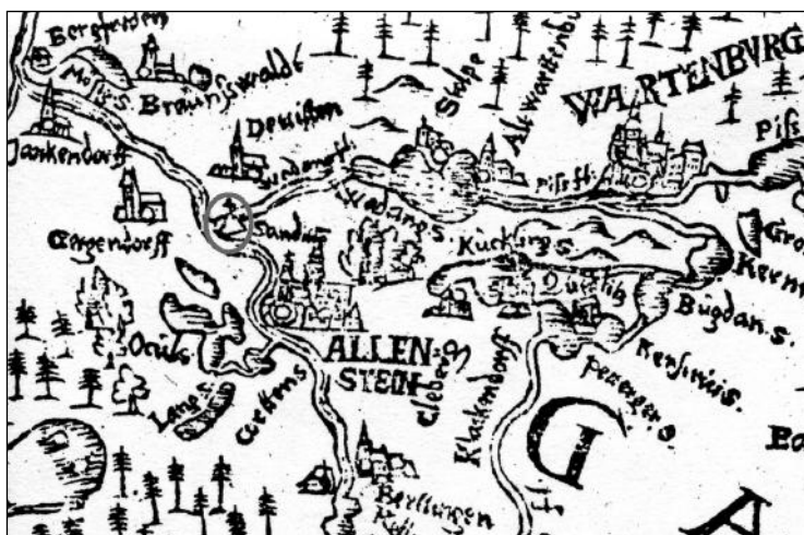
Ryc. 4. Fragment mapy K. Hennenbergera przedstawiający okolice Olsztyna. Na północ od miasta zaznaczono sygnaturą grodzisko Sądty (Sandlitten)