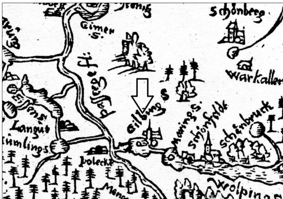
Jezioro Giełży (Gilbing) i kościół w Gietrzwałdzie, mapa Kaspra Hennenbergera z 1576 r. (fragment)