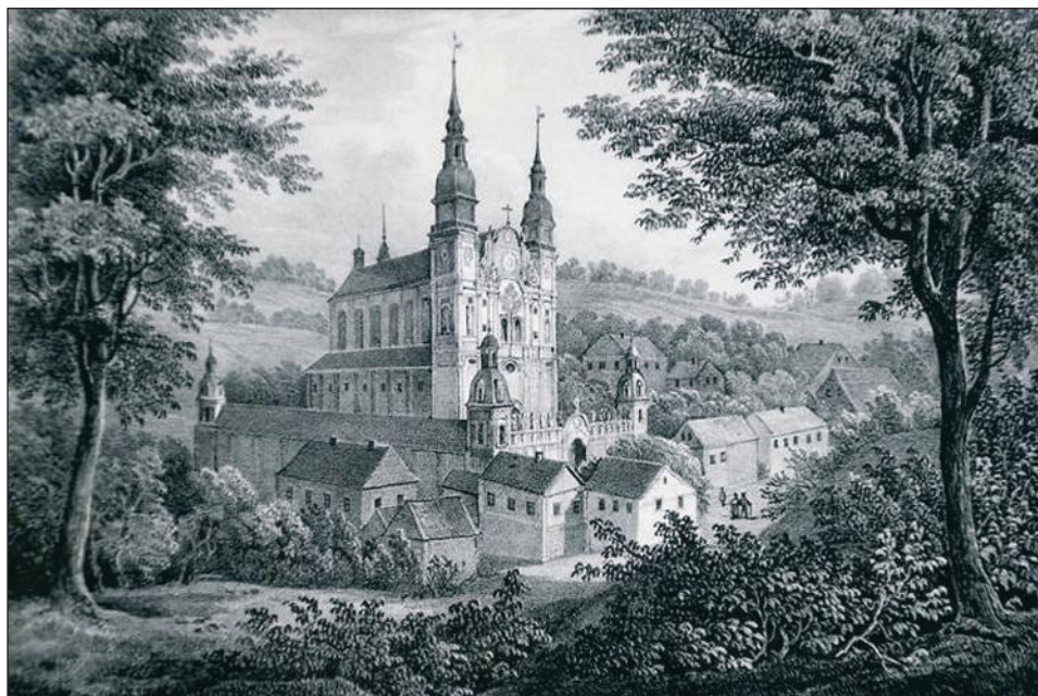
Klasztor w Świętej Lipce, litografia z 1838 r.